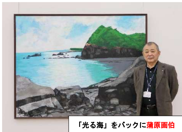
「光る海」をバックに蒲原画伯

彼とは職場を共にした長い付き合いです。彼は明るく人付き合いがよく誰からも好かれており、我々職場仲間は今でも「カンチャン」と呼んでいます。