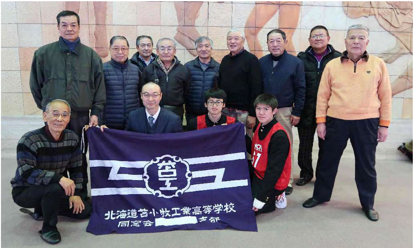
応援団の皆さんと集合写真